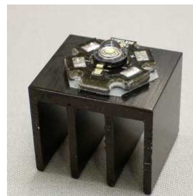
SK452 mit --> montierter 3 Watt Luxeon LED