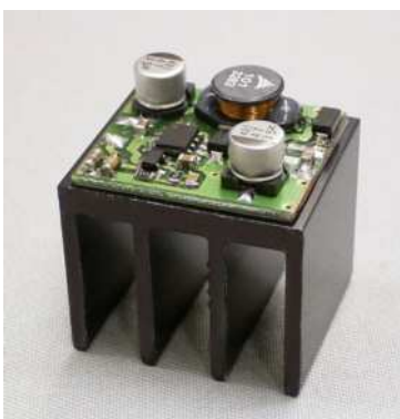
← SK452 mit montiertem HKO1000